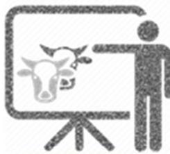
ET VE SÜT BESİCİLİĞİ Etik değerlere bağlı büyük ve küçükbaş besicilik yatırımları