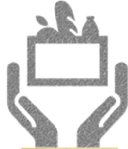
TARIMSAL TİCARET Tarımsal değer zincirindeki alanlara yatırım