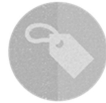
MARKALI ÜRÜNLER Nihai tüketiciye sunulan tarıma dayalı markalı ürünlere yatırım